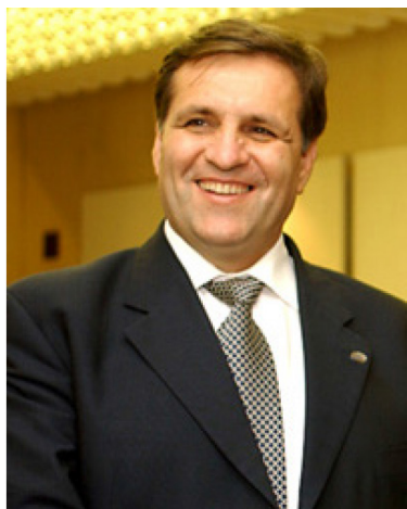
Борис Трајковски, втор претседател на РМ (1999-2004)

Поради ваквиот развој на настаните, партијата Внатрешна македонска револуционерна организација – Демократска партија за македонско национално единство (ВМРО-ДПМНЕ), која го предложи Љубиша Георгиевски за претседател, поднесе приговор до Државната изборна комисија (ДИК) со барање изборите да бидат поништени. Приговорот беше одбиен и со тоа Кирил Глигоров стана првиот претседател во Република Македонија избран на општи и непосредни избори. Кирил Глигоров ја извршуваше функцијата шеф на државата до 19 ноември 1999 година. 25