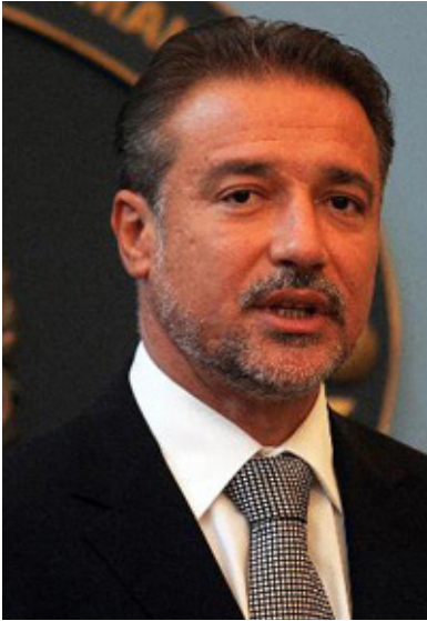
Бранко Црвенковски, трет претседател на РМ (2004-2009)

излегоа 1 039 602 избирачи или 64,44 % од запишаните избирачи во Избирачкиот список. 27 Во вториот круг од изборите учествуваа Тито Петковски и Борис Трајковски. По одржаниот втор круг и по прегласувањето во одредени избирачки места, Борис Трајковски освои 52,4 % од гласовите (582 808 гласа), а Тито Петковски 46,18 % (513 614 гласа). Вкупно 16 821 гласачки ливчиња беа прогласени за неважечки (1,01 %). На гласањето во вториот круг излегоа вкупно 1 096 422 избирачи или 68,08 % од регистрираните гласачи. 28 Борис Трајковски ја извршуваше функцијата претседател на Република Македонија од 15 декември 1999 до 26 февруари 2004 година. 29