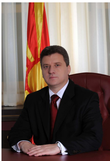
Ѓорге Иванов, четврт претседател на РМ (2009-2019)

Во вториот круг учествуваа 909 289 избирачи или 53,6 % од запишаните избирачи во Избирачкиот список. Бранко Црвенковски ја извршуваше функцијата претседател на Република Македонија од 12 мај 2004 до 12 мај 2009 година.