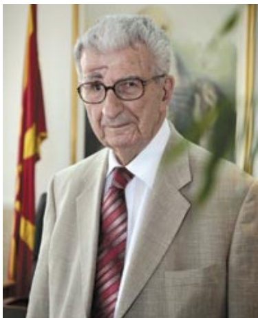
Киро Глигоров, прв претседател на РМ (1991-1999)

Првиот претседател на независна Република Македонија беше Киро Глигоров. На 27 јануари 1991 година тој со тајно гласање беше избран во македонското Собрание со 114 пратенички гласа „ЗА“ од вкупно присутни 119 пратеници. 20 Сите подоцнежни избори за претседател се одвиваа на општи и непосредни избори на кои имаа можност да учествуваат сите граѓани со право на глас запишани во Избирачкиот список.